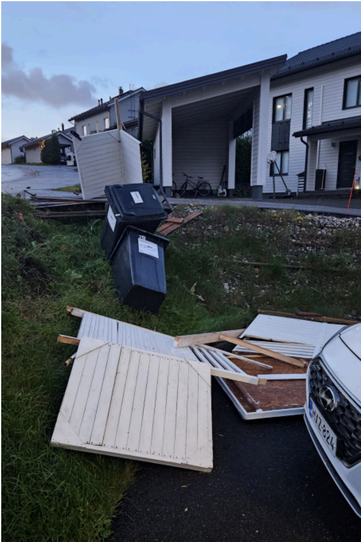
2. Rajatorpan koulu, Nikkarin päiväkot, Vapaalan päiväkodit (Vapaalankuja)

-Vapaalantiellä pysäköintipaikkoja, jotka palvelevat Nikkarin päiväkodin lasten vanhempia -Vapaalankujan pysäköinti siirretään kokonaan jalkakäytävän puolelle. Tällä hetkellä kun pysäköinti on Nikkarin PK:n puolella, niin se on hengenvaarallinen koska poistuminen